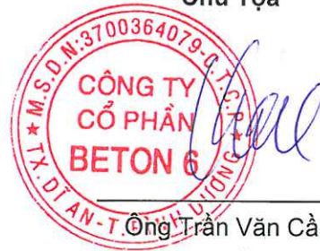
Ông Trần Văn Cầu Chủ tịch Hội Đồng Quản Trị